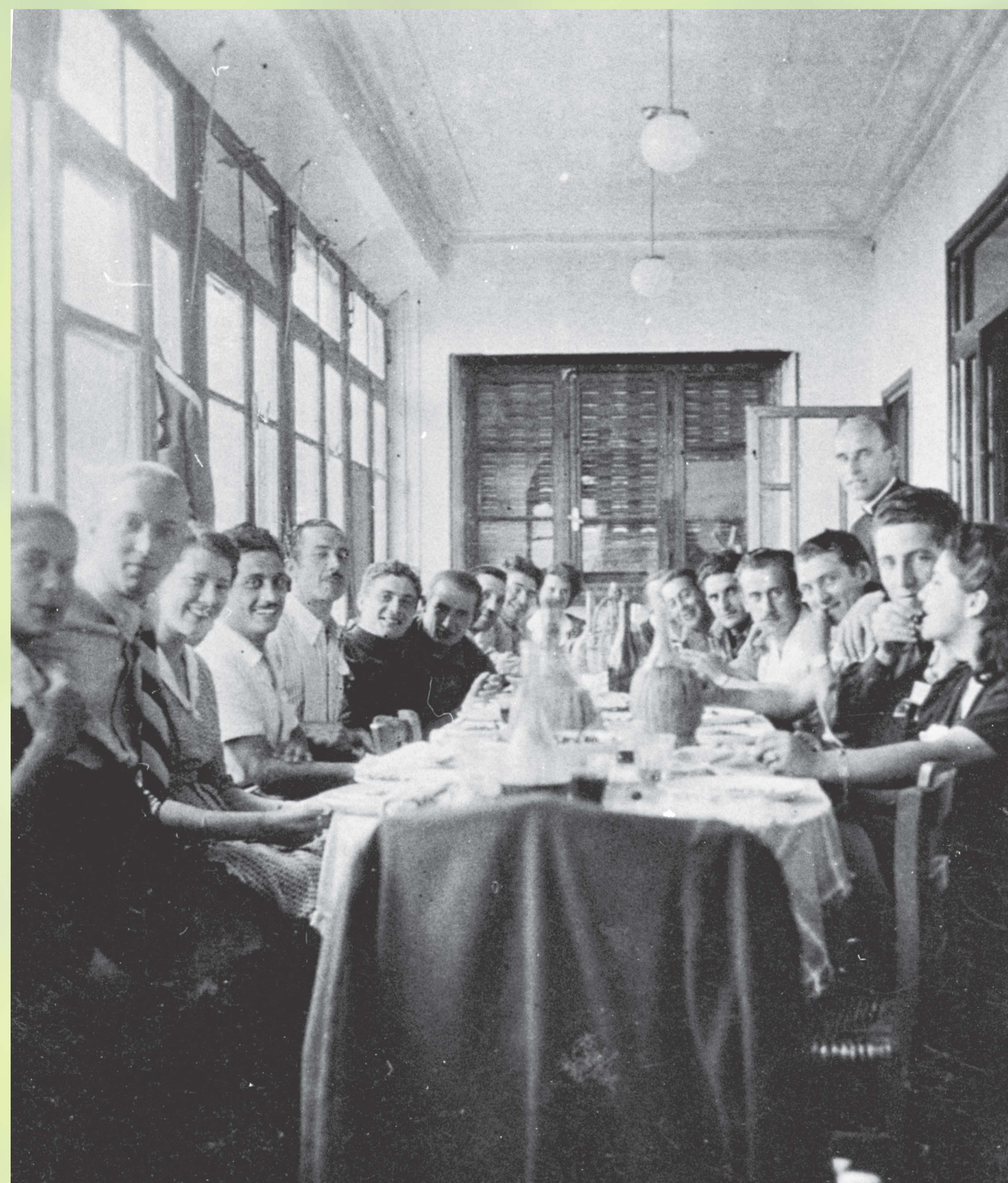
Pranzo a villa Badone dopo la Liberazione

Una circostanza che avrebbe potuto creare attrito, ma che Badone accettò di buon grado inaugurando relazioni cordiali con i partigiani, che sarebbero durate anche a guerra finita.