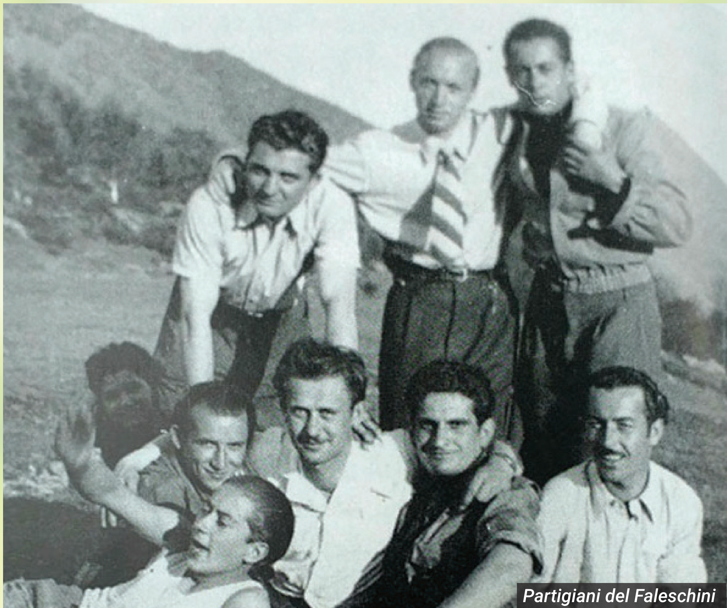
Partigiani del Faleschini

La situazione precipitò a causa di due eventi imprevisti: l'attacco partito dal presidio fascista di Col San Giovanni, in Val di Viù, che il distaccamento Tolmino non riuscì a contenere; e il sopraggiungere dal Colle La Bassa, tra il Sapei e il Civrari, degli alpenjaeger provenienti dalla Valle del Sessi e avvolti nella nebbia.