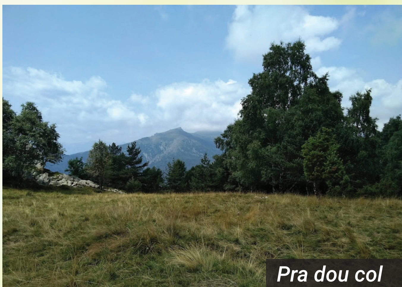
Pra dou col

L'attacco scattò la notte del 29 marzo dalla valle di Susa e penetrò profondamente non solo in Val Messa, ma anche nella Valle del Sessi risalendo da Caprie verso il Collombardo, prima di essere percepito dalle sentinelle della brigata. Mentre il Giroto rallentava l'avanzata nemica, il comando della brigata protetto dal Faleschini organizzò lo svuotamento dei magazzini.