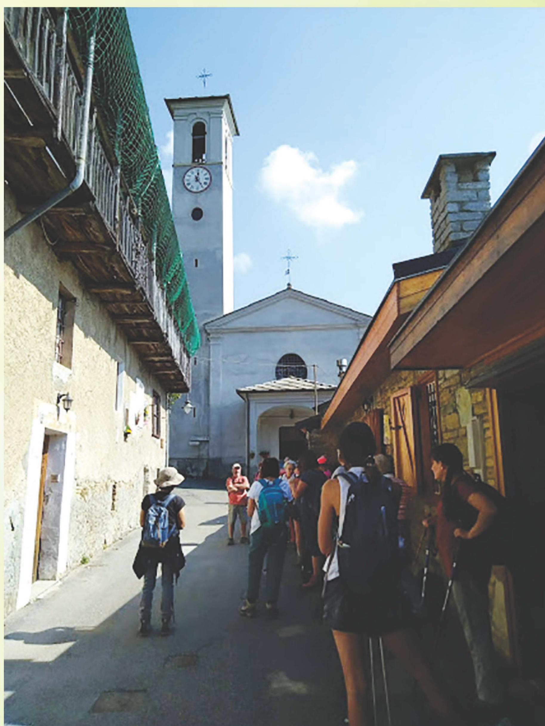
Il sentiero di Mompellato