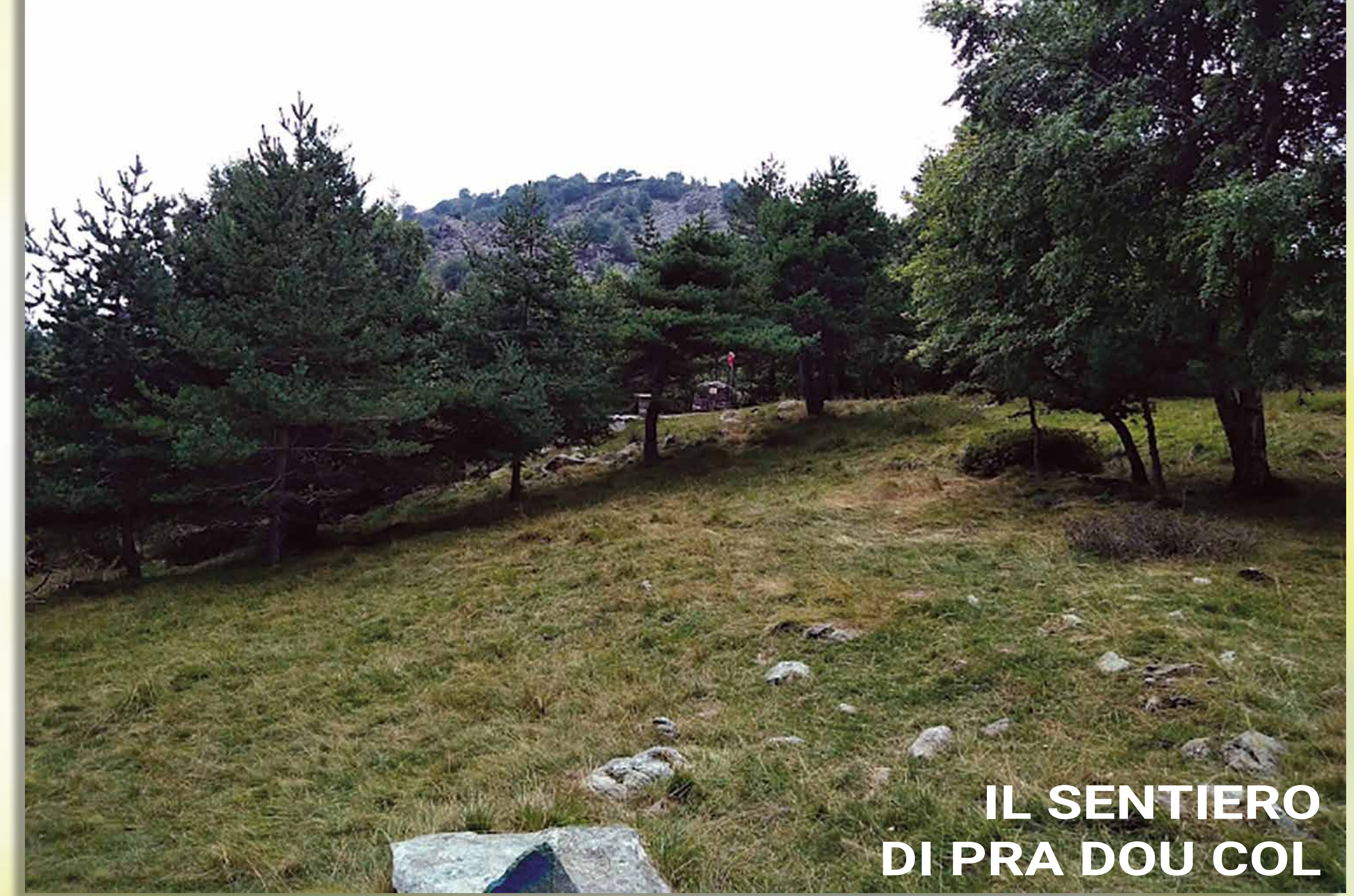
IL SENTIERO DI PRA DOU COL