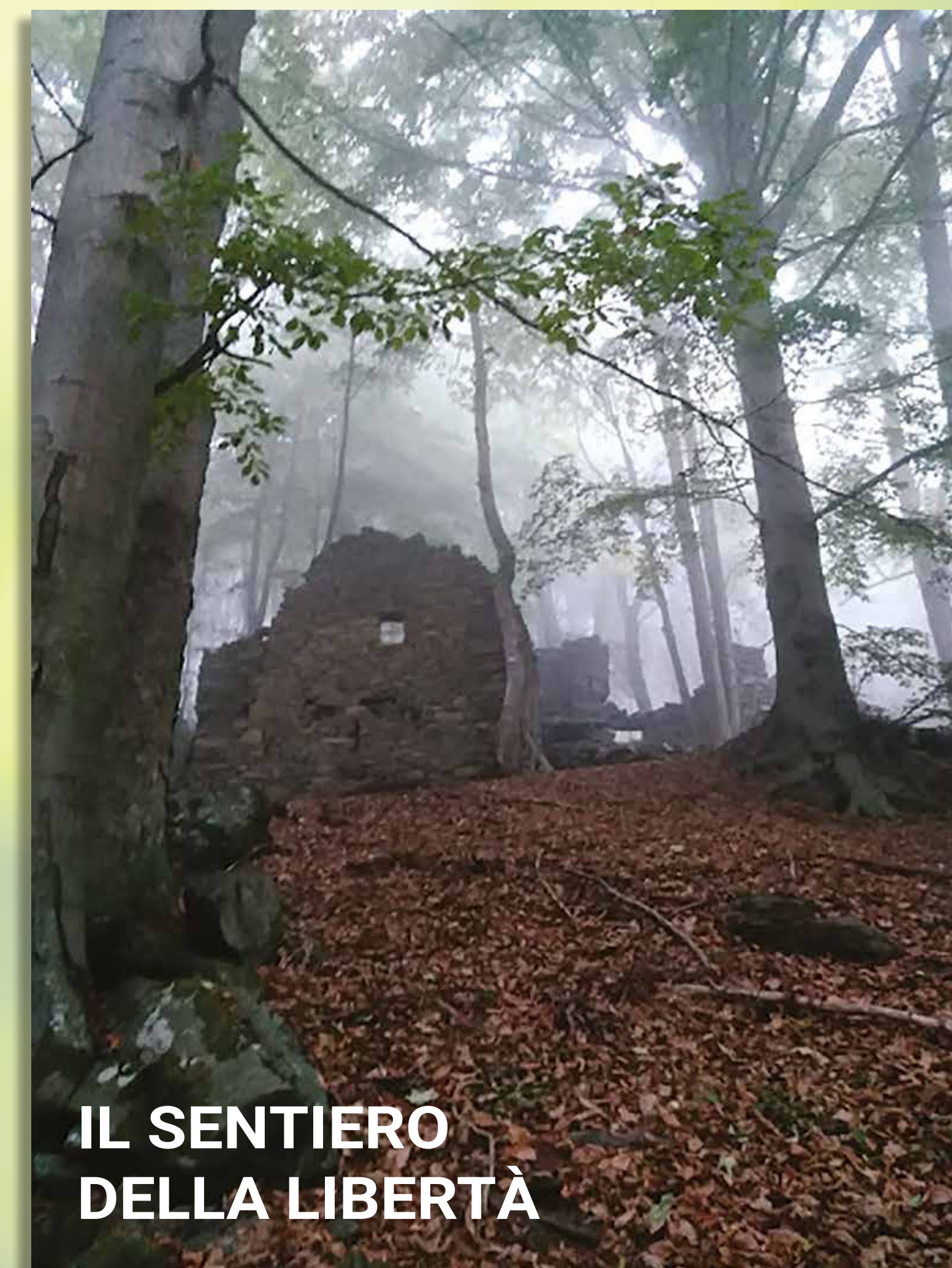
IL SENTIERO DELLA LIBERTÀ

Per celebrare il supporto decisivo offerto dalla popolazione civile ai partigiani, nel 1994 il Comitato Resistenza Colle del Lys ha realizzato a Favella un parco giochi nel quale ha posto una stele commemorativa.