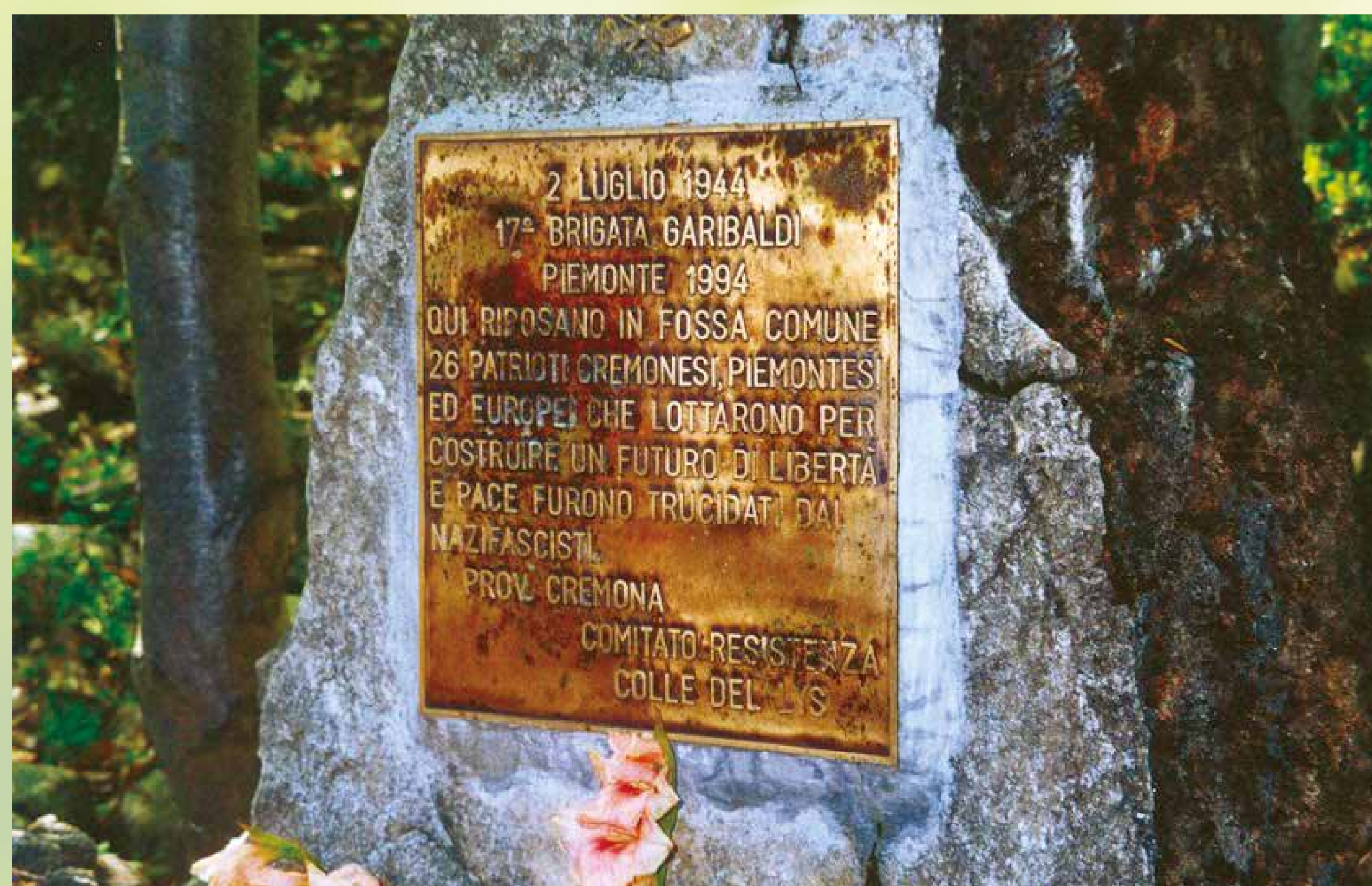
IL SENTIERO DELLA FOSSA COMUNE

È interessante rilevare come l'iscrizione del cippo contabilizzi i caduti qui ricordati nel numero di 26 anziché di 23: 26 era infatti la stima più accreditata dalla memoria collettiva della Resistenza locale a metà degli anni Novanta e solo nel primo decennio di questo secolo la ricerca storica ha saputo correggerla, attribuendo alla strage la sua reale entità quantitativa.